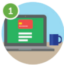
1 Crear una cuenta